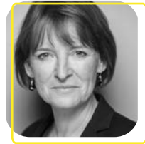
HEAL EDINA Magyarországi vezető, Google

Köszönjük nekik a szakmai támogatást és töretlen lelkesedést!